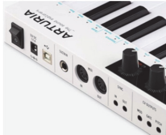
Figure I.2. Ports MIDI et CV/Gate (Arturia Keystep)

de la fin des années 1970, et la norme MIDI, apparue dix ans plus tard, sont devenues essentielles et indispensables. Il me semblait opportun de préciser leur principe et de définir leur fonctionnement dans le chapitre 5 de ce volume 1.